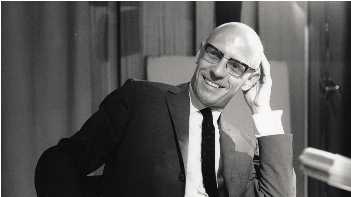
Michel Foucault